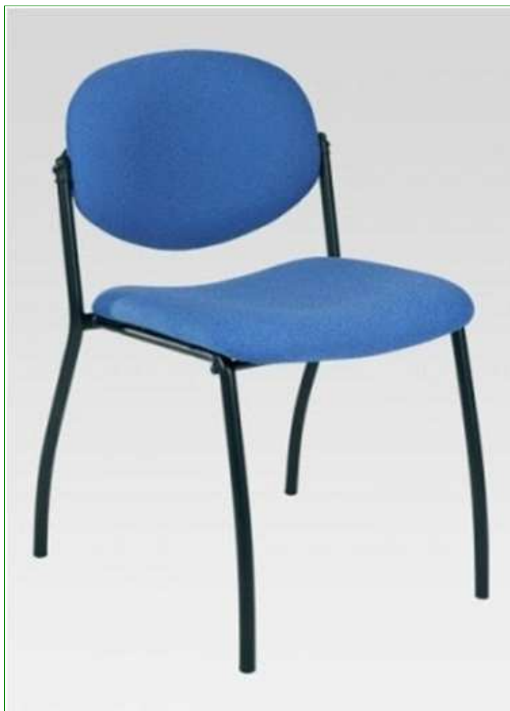
N19 - židle s čalouněným sedákem

POZNÁMKA: ROZMĚRY JSOU UVEDENY V MILIMETRECH VÍTEZNÝ UCHAZEČ SI VŠE ZAMĚŘÍ NA MÍSTĚ